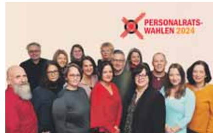
Bei den Wahlen zum Hauptpersonalrat Schule beim Hessischen Kultusministerium wurde die GEW als mit Abstand stärkste Kraft bestätigt. Für die Kandidat:innen der GEW stimmten 65,8 Prozent der Beamt:innen und 61,4 Prozent der Angestellten. Auch in der neuen Wahlperiode ist die GEW demnach mit 15 von 23 Mitgliedern als stärkste Fraktion vertreten und gewinnt im Vergleich zur Wahl 2021 einen Sitz hinzu.

Der Hauptpersonalrat kritisiert insbesondere, dass es sich hier um eine weitere Aufgabe handle, die zwar für sinnvoll erachtet werden könne, jedoch erneut Mehrarbeit für die beteiligten Lehrkräfte erzeuge.