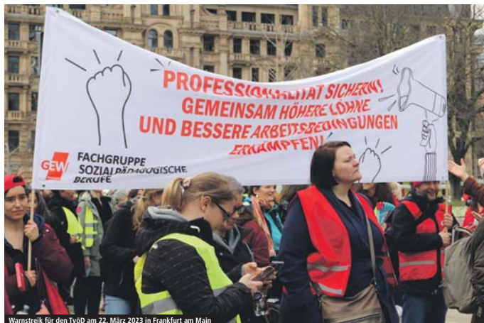
Warnstreik für den TvoD am 22. März 2023 in Frankfurt am Main