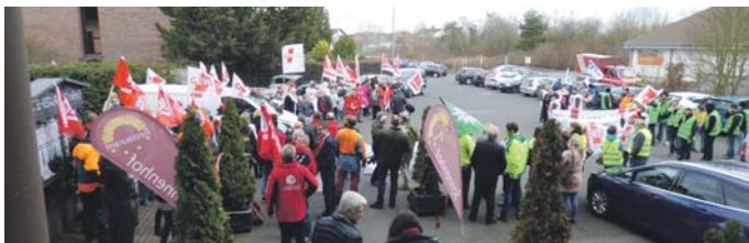
„Empfangskomitee“ der ÖD-Gewerkschaften vor dem Hotel in Dietzenbach, in dem am 6./7.3.2024 die entscheidende Tarifverhandlung stattfindet; hier, anlässlich einer Tarifverhandlung mit Innenminister Beuth.

45 Prozentpunkte mehr wären ein beachtliches Plus über eine Anhebung der Tabellenentgelte hinaus.