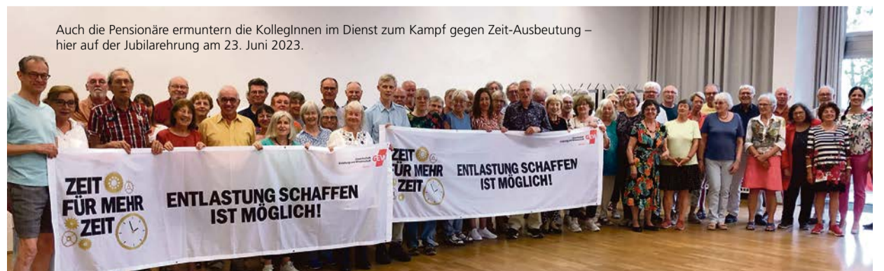
Auch die Pensionäre ermuntern die KollegInnen im Dienst zum Kampf gegen Zeit-Ausbeutung – hier auf der Jubilarehrung am 23. Juni 2023.