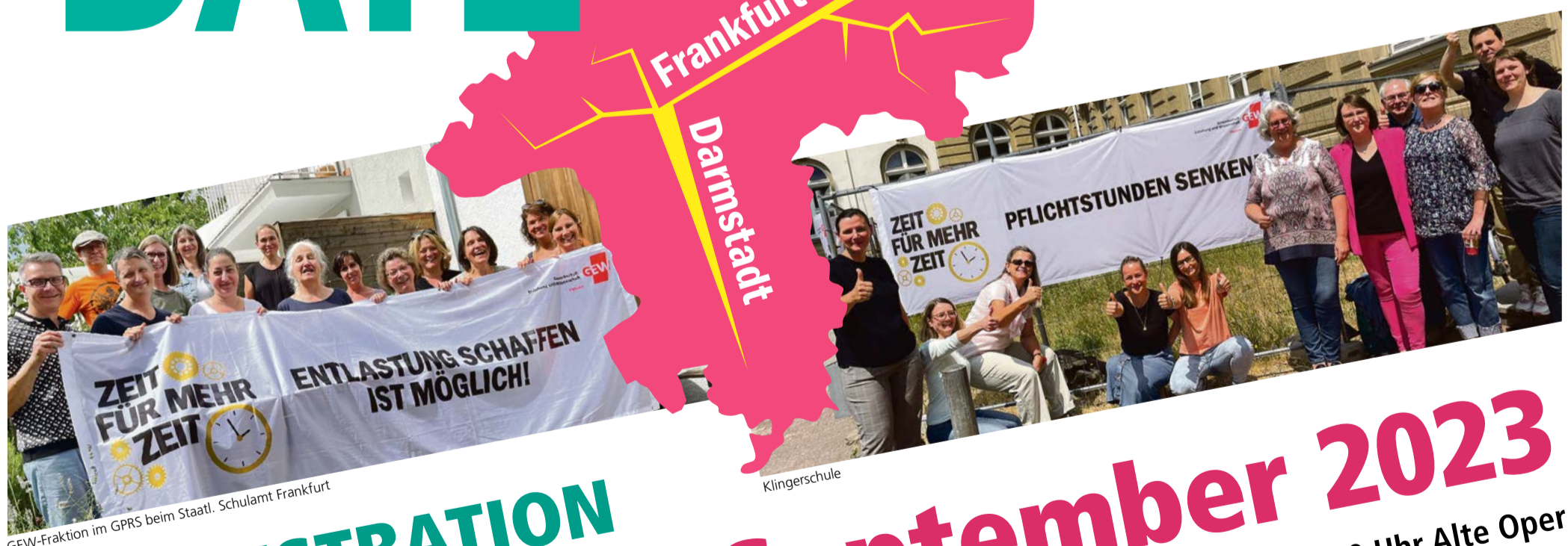
GEW-Fraktion im GPRS beim Staatl. Schulamt Frankfurt