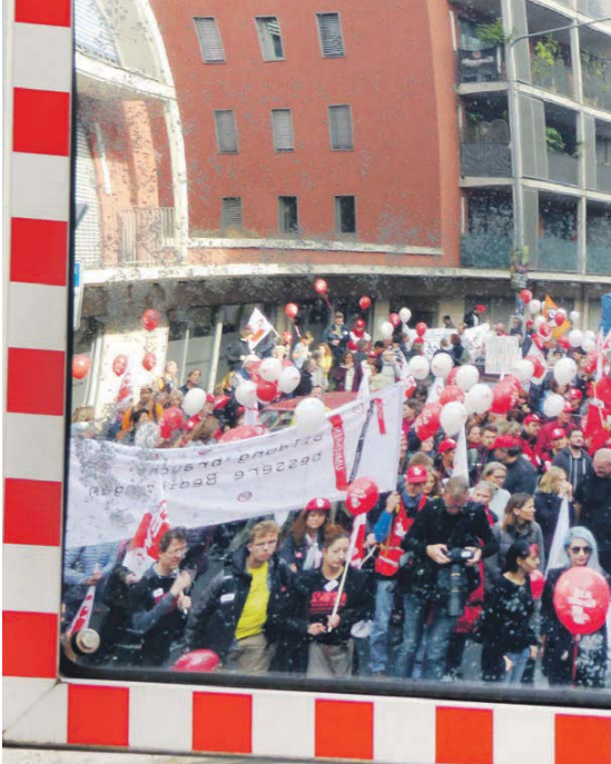
„Rückblick:“ GEW-Demonstration am 22. September 2018 in Frankfurt am Main

In Hessen funktionieren die Bildungseinrichtungen perfekt, es gibt ausreichend Personal und dieses kann in Ruhe dem Bildungs- und Erziehungsauftrag nachgehen. Meldungen und Hilferufe von Beschäftigten, Personal- und Betriebsräten und der GEW sind reine Panikmache.